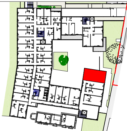
TABEAU DES SURFACES