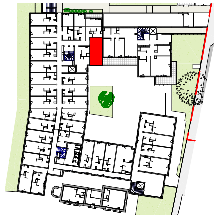
TABEAU DES SURFACES